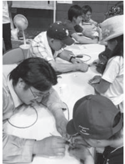
子供向け体験コーナー（テーブルタップづくり）