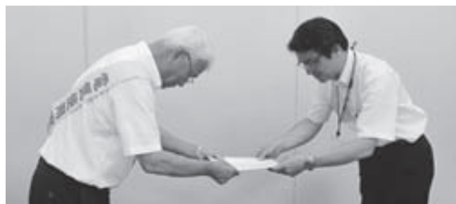
関西電力(株)京都電力本部にて趣意書を手渡す

今年は台風20号（8月18日襲来）の影響により、配線診断が実施できなかった支部・地区もありましたが、猛暑の中、ご協力いただきました関係者の皆様、活動に参加いただきました組合員の皆さま、本当にお疲れ様でした。ありがとうございました。