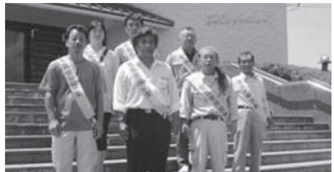
啓発活動（那賀支部）