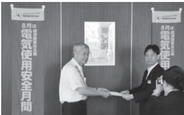
関西電気保安協会