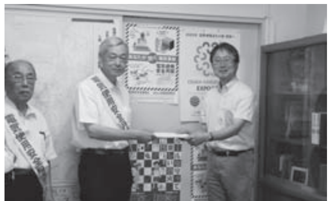
中部近畿産業保安監督部近畿支部