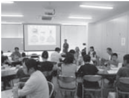
LEDソーラーライト組み立て工作教室（和歌山支部）