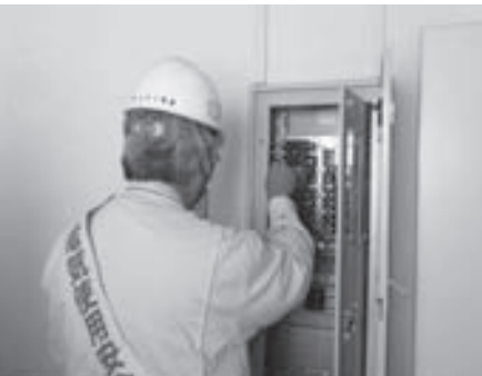
集会場無料電気設備点検（海南海草支部 第一ブロック）