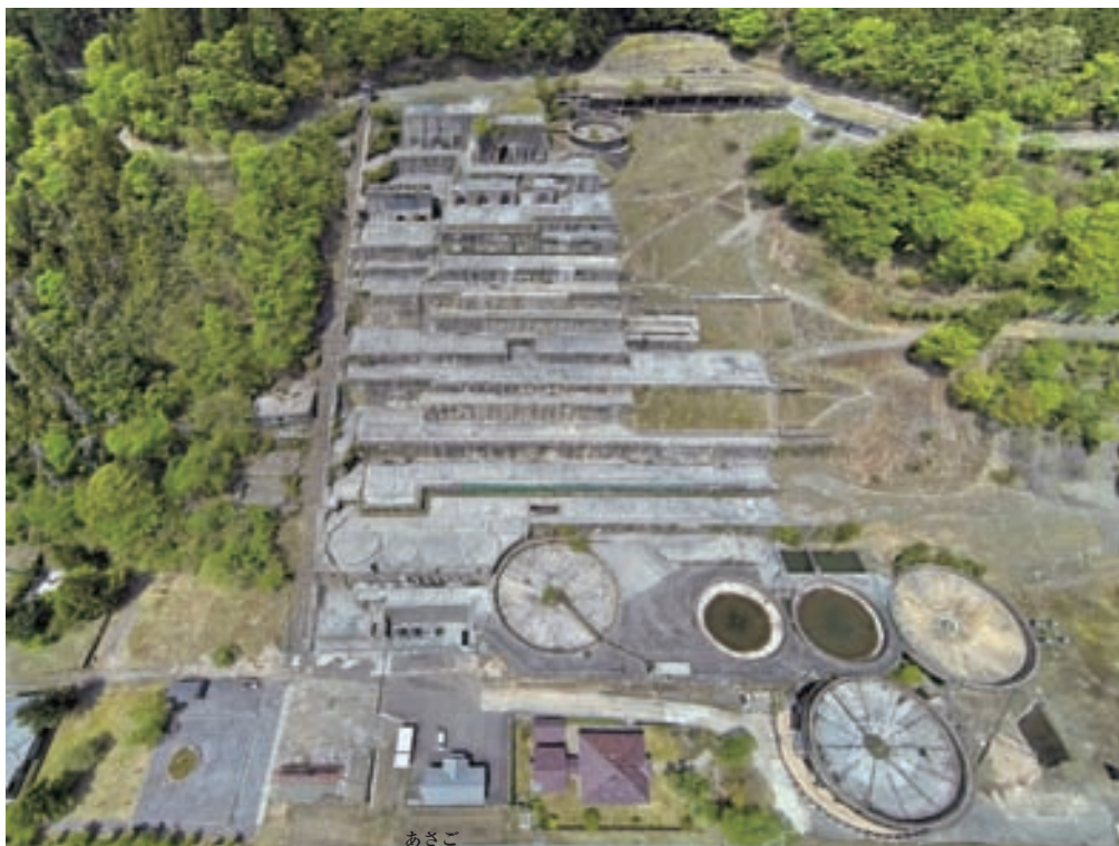
兵庫県朝来市 神子畑選鉱場跡

神子畑選鉱場はかつて隣町にあった明延鉱山（金・銀・銅・鉛・錫などを産出）の選鉱場として建設された。山の斜面を利用したこの選鉱場の規模は当時「東洋一」と謳われた。昭和30年ごろには、24時間稼働し、夜間は不夜城のようだったらしい。