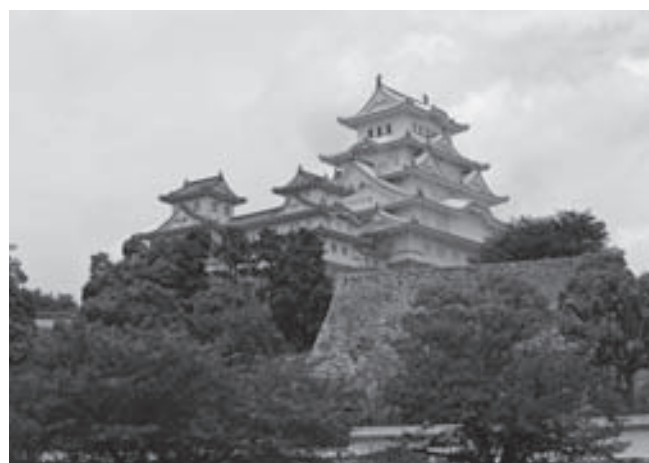
姫路城 三国堀から