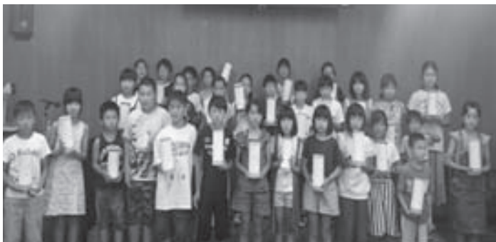
LED親子工作教室（新宮支部）