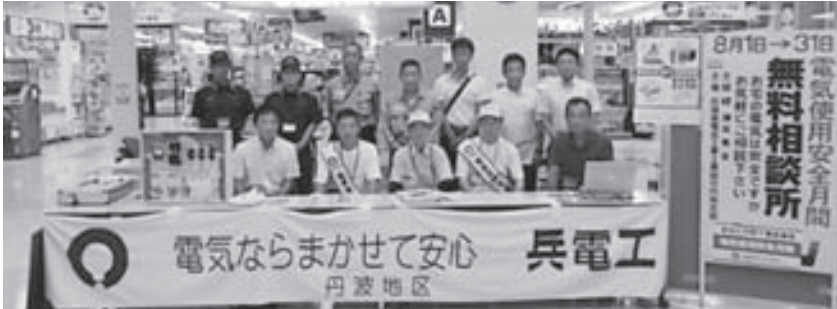
無料電気相談所開設