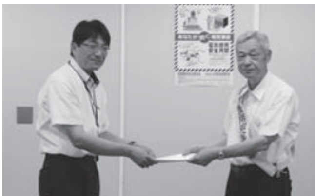
大阪府政策企画部危機管理室