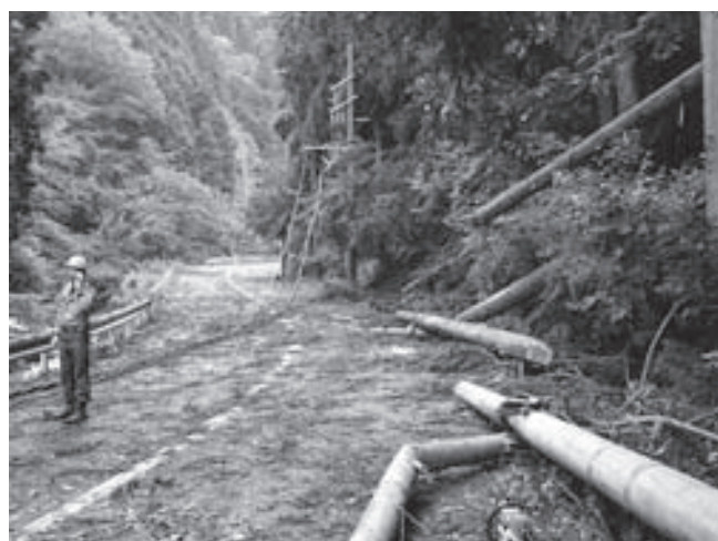
倒木、電柱倒壊現場