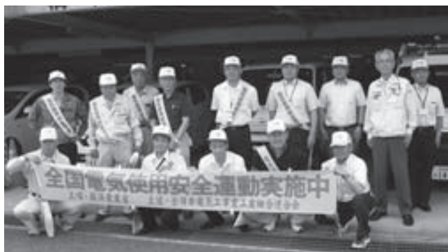
関西電力(株) 高田配電営業所