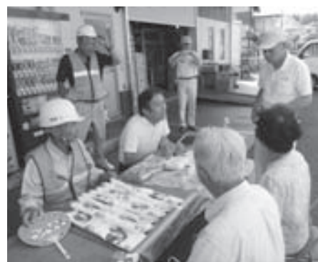
無料相談高島支部