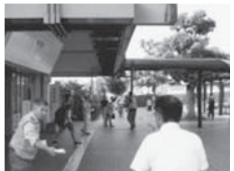
南海林間田園都市駅前啓発活動（橋本伊都支部）