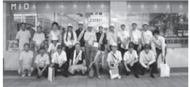
和歌山駅前 啓発活動（和歌山支部）