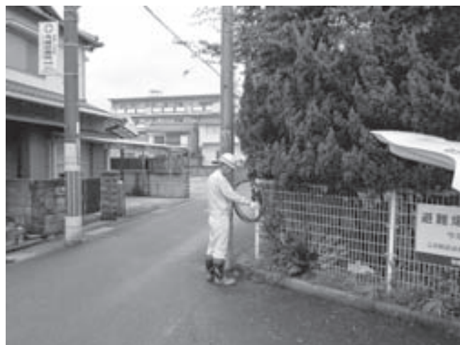
垂れ下り電線の処理