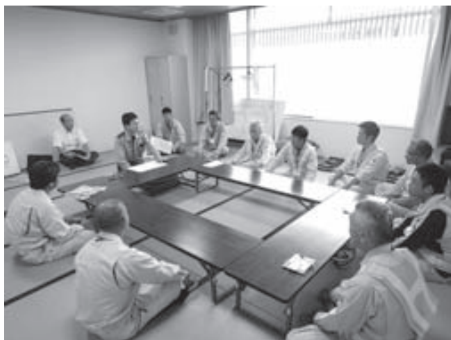
ミーティング風景