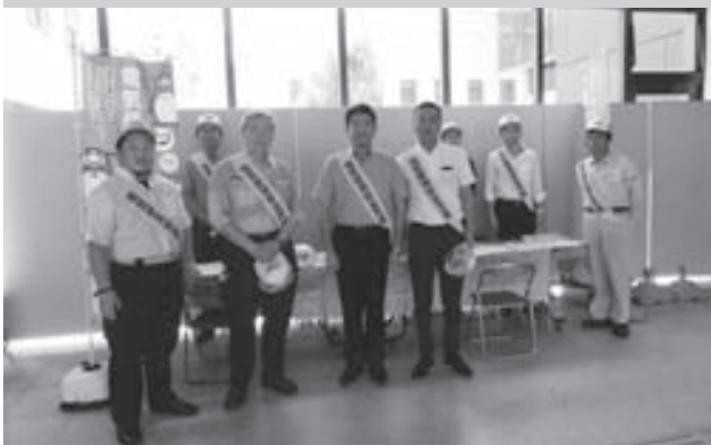
仲川げん奈良市長（中央）