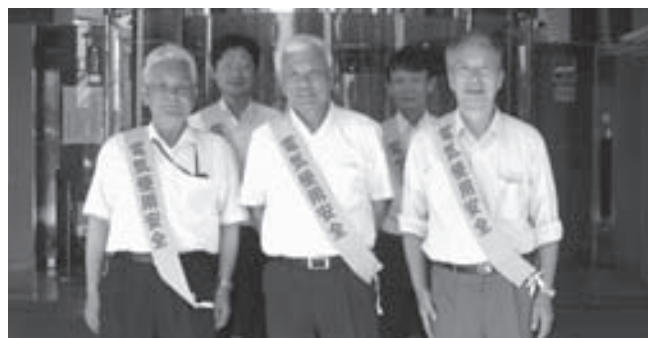
関西電力(株)京都配電営業所前にて