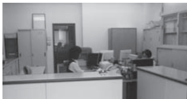
社 内 風 景