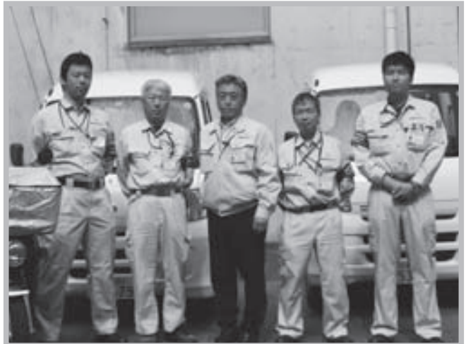
南丹事業所メンバー