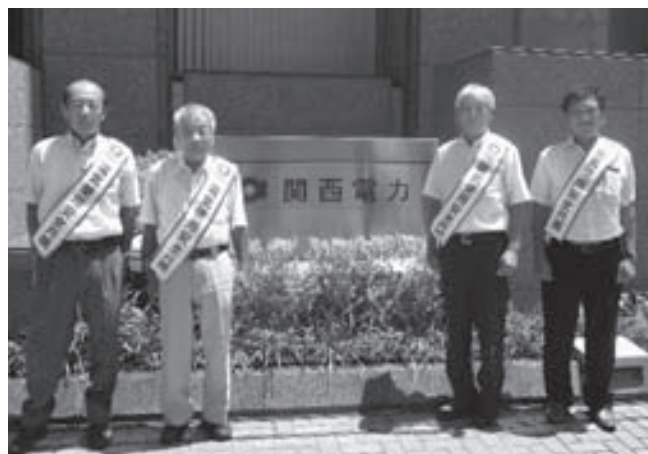
関西電力(株)神戸支社前

電気設備の無料診断、公園などの街路灯の点検清掃、子供向け体験コーナー開催など、猛暑の中、多くの組合員・従業員が活動に参加しました。