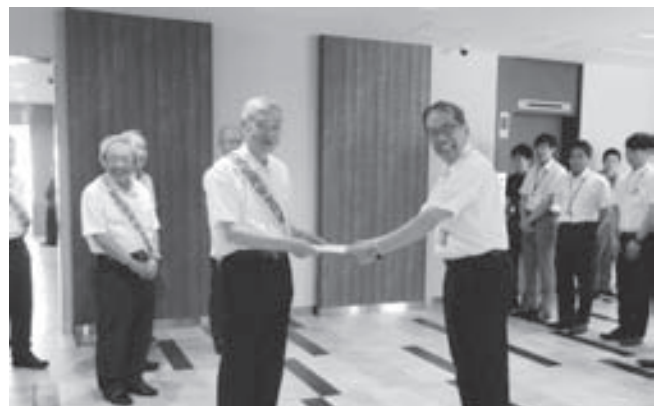
関西電力(株)大阪南電力本部