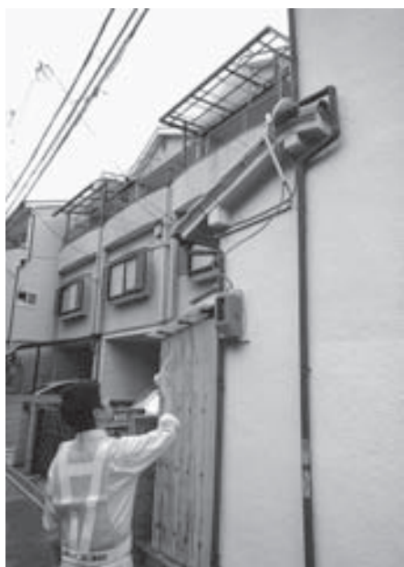
引込計器、支持点確認