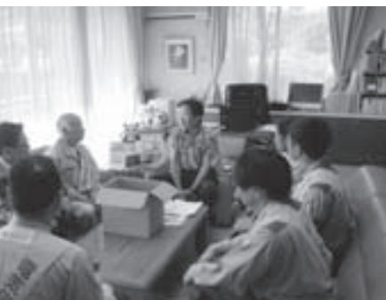
白浜町役場表敬訪問（田辺支部）