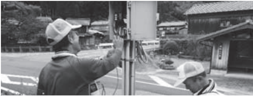
高齢者宅の設備点検