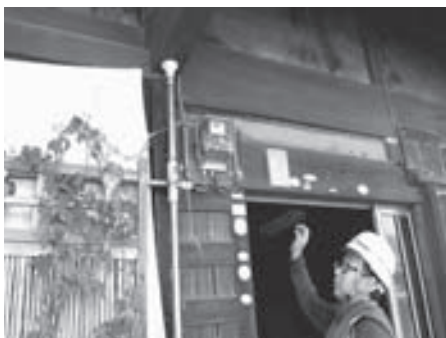
高齢者宅への訪問・電気無料安全点検（日高支部）