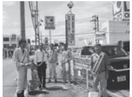
有田支部前 啓発活動（有田支部）